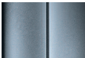
Sivá Aluminium - metalická