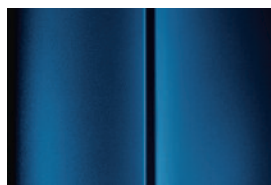
Modrá Kyanos - metalická