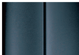
Sivá Fer - metalická