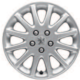
Hliníkové disky 16" Vivace