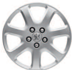
Kryty kolies 16" Novae