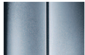
Modrá Philae - metalická