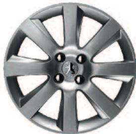
Hliníkové disky 18" Magnetik