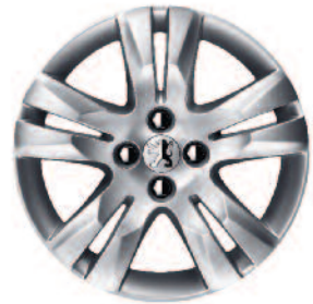
Hliníkové disky 17" Quark