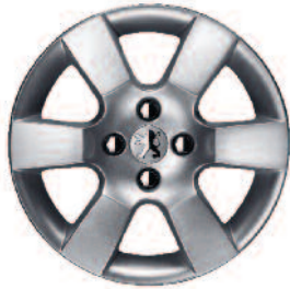
Hliníkové disky 16" Eris