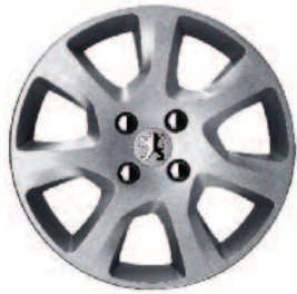
Kryty kolies 16" Haumea