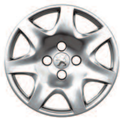
Kryty kolies 15" Pacaya