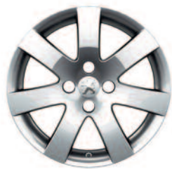
Hliníkové disky 16" Santiago