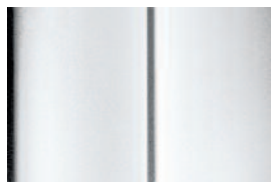
Biela Nacre - perleťová