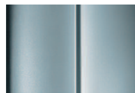
Sivá Aluminium - metalická