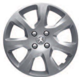
Kryty kolies 17" Atax