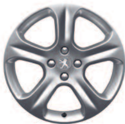
Hliníkové disky 18" Exona