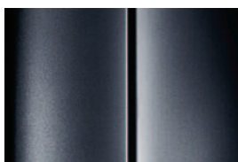
Sivá Shark - metalická