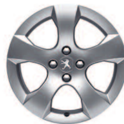
Hliníkové disky 17" Savara