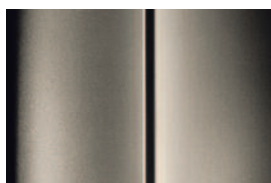
Vapor Grey - metalická