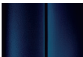
Modrá Abyss - metalická