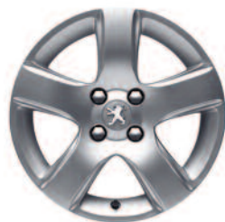
Hliníkové disky 16" Isara